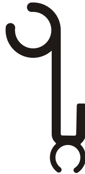
barra in alluminio aluminium beam